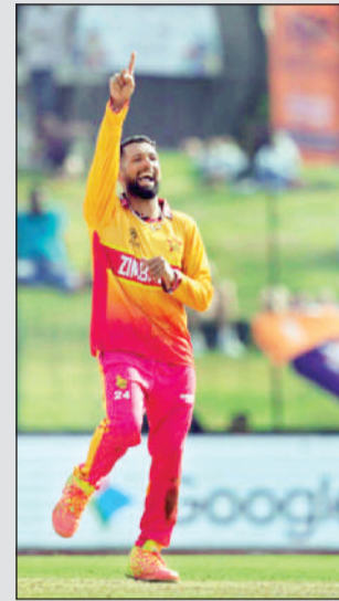
कोलंबो। जिम्बाब्वे ने सिंहाली स्पोर्ट्स क्लब में सोमवार को खेले गए टी20 वर्ल्ड कप 2026 के आठवें मुकाबले में ओमान के विरुद्ध