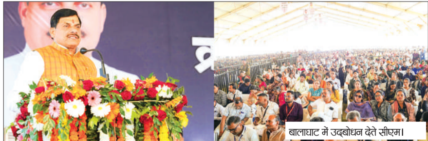
बालाघाट में उद्बोधन देते सीएम।

सीएम ने रिमोट से किया 31 पुलिस स्टेशनों और अन्य शासकीय कार्यालयों का लोकार्पण