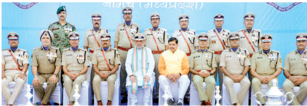
नक्सलियों को खदेड़ा और 4 दुर्दांत नक्सलियों को मार गिराया

नक्सल प्रभावित 250 स्कूलों का नवीनीकरण किया गया: मुख्यमंत्री डॉ. यादव ने कहा कि भविष्य में नक्सलियों को इस स्थान पर अपने पैर जमाने के लिए कोई मौका न मिले,