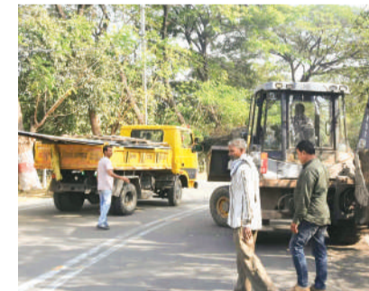
अतिक्रमण हटाने बड़ी संख्या में पहुंचे कर्मचारी।