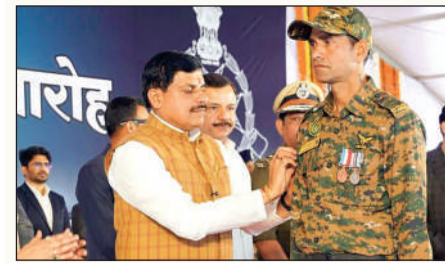
जवानों को सम्मानित करते सीएम डॉ. यादव

नक्सल मुठभेड़ में अदम्य साहस और वीरता का परिचय दिया