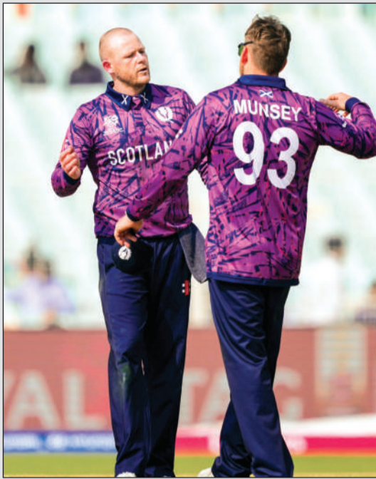
लिसक को प्लेयर ऑफ द मैच का खिताब

टी20 विश्व कप के इतिहास में स्कॉटलैंड ने एक बड़ा रिकॉर्ड अपने नाम कर लिया है। एसोसिएट देश के रूप में स्कॉटलैंड ने टी20 विश्व कप की एक पारी में सबसे ज्यादा रन बनाने की उपलब्धि यूएसए को पीछे छोड़ते हुए अपने नाम कर ली है। कोलकाता के इंडन गार्डन में सोमवार को हुए मुकाबले में स्कॉटलैंड ने इटली के खिलाफ टॉस गंवाकर पहले बल्लेबाजी करते हुए 4 विकेट पर 207 रन बनाए। टी20 विश्व कप में किसी भी एसोसिएट देश का एक पारी में बनाया गया यह सबसे बड़ा स्कोर है। पूर्व में यह रिकॉर्ड यूएसए के नाम था। टी20 विश्व कप 2024 में यूएसए ने कनाडा के खिलाफ दूसरी पारी में 3 विकेट पर 197 रन बनाकर जीत हासिल की थी। इसी मैच में कनाडा ने पहली पारी में 194 रन बनाए थे। इटली को टी20 विश्व कप के अपने पहले मुकाबले में 73 रन से हार का सामना करना पड़ा है। स्कॉटलैंड के लिए 208 रन के लक्ष्य को हासिल करने उतरी इटली 16.4 ओवर में 134 पर आउट हो गई।