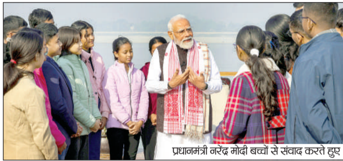
प्रधानमंत्री नरेंद्र मोदी बच्चों से संवाद करते हुए

एक हिस्सा है। उन्होंने छात्रों को सलाह दी कि वे खुद की तुलना दूसरों से न करें और अपनी क्षमताओं पर भरोसा रखें। पीएम मोदी ने यह भी स्पष्ट किया कि दबाव में पढ़ाई करने से परिणाम बेहतर नहीं होते, बल्कि संतुलित दिनचर्या और सकारात्मक सोच ज्यादा जरूरी है। पीएम मोदी ने कहा कि परीक्षा पे चर्चा का उद्देश्य परीक्षा को डर का कारण नहीं, शेष पेज 4 पर