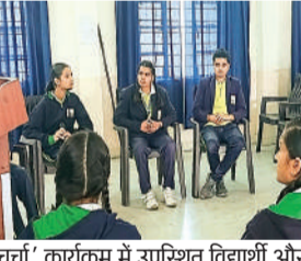
'बजट पे चर्चा' कार्यक्रम में उपस्थित विद्यार्थी और अभिभावक।

शिक्षा, तकनीक, डिजिटल इंडिया, एमएफएम, स्टार्टअप, सेमीकंडक्टर मिशन और मेक इन इंडिया जैसी पहलों को भारत को आत्मनिर्भर बनाने की दिशा में महत्वपूर्ण कदम बताया। उनका मानना था कि ये योजनाएं दीर्घकाल में रोजगार के अवसर बढ़ाएंगी और देश की अर्थव्यवस्था को मजबूती प्रदान करेंगी। विद्यालय प्रबंधन ने