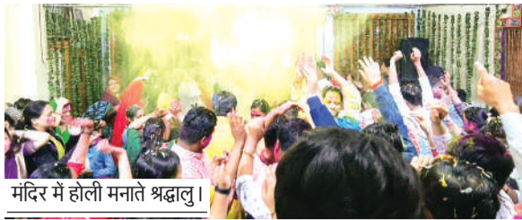
मंदिर में होली मनाते श्रद्धालु।

हरिभूमि न्यूज ॥ भोपाल इतवार स्थित श्री हित रसिक राधावल्लभ मंदिर में फाल्गुन मास की पहली भव्य होली का आयोजन श्रद्धा और उल्लास के साथ सोमवार को संपन्न हुआ। इस अवसर पर लगभग 50 किलो फूलों जैसिमं गेंदा, गुलाब एवं सेवती तथा 30 किलो गुलाल के साथ भक्तों ने होली उत्सव मनाया। विशेष बात यह रही कि उत्सव में प्रयुक्त रंग पूर्णतः हर्बल था, जिसे अरारोट तथा पुष्पों से तैयार किया गया था। संस्था आरती के बाद होली उत्सव का शुभारंभ हुआ, जिसमें ब्रज रसिक मंडली ने ब्रज भाषा में