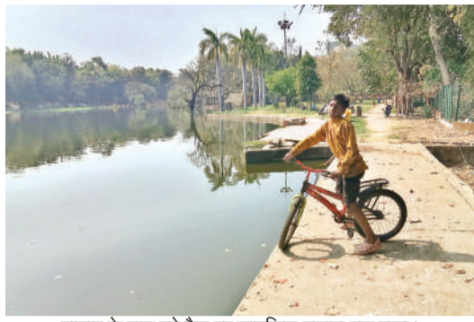
तालाब के पास बने ट्रैक पर साइकिल चलाता एक बच्चा।

मामूली चूक से हो सकता है बड़ा हादसा, ट्रैक पर चलना भी घातक