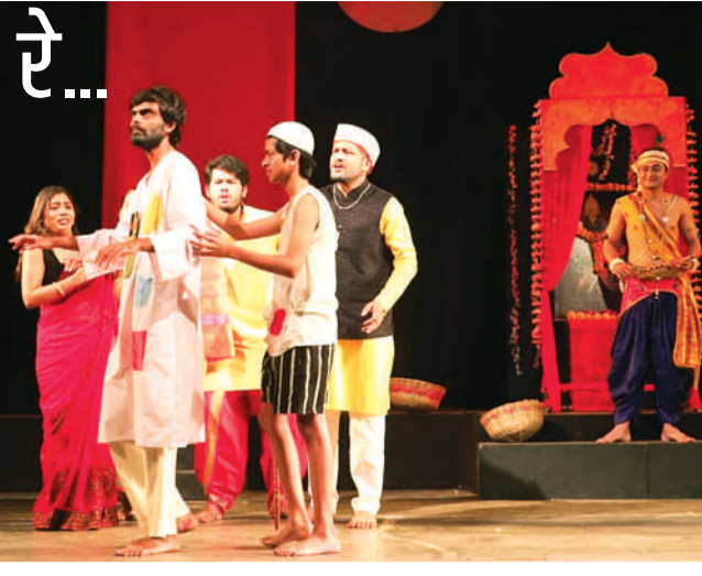
नाटक की प्रस्तुति देते कलाकार।

नाटक में दिखाया गया कि आज के समय में दिखावे की धार्मिकता और दिखावे की श्रद्धा ने समाज में ऐसे पैर पसारें हैं कि लोग उसी को सच मानने लगे हैं। फिर वो नेताओं के भ्रष्टाचार के पीछे धार्मिक आयोजन करना हो या युवाओं का सफलता पाने के लिए भगवान का सहारा लेना। दिखावे से भरे आधुनिकता के इसी रूप को जन मानस के सामने प्रस्तुत किया गया कि कैसे धर्म के नाम पर लोग भगवान के द्वार खटखटाते हैं और काम होने पर भूल जाते हैं।