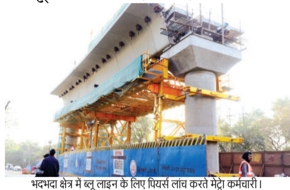
भदभदा क्षेत्र में ब्लू लाइन के लिए पियर्स लांच करते मेट्रो कर्मचारी।