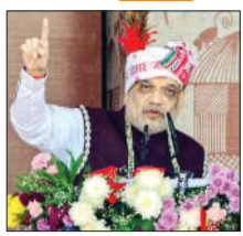
स्कूल और अस्पताल जलाने वालों को नहीं बरतेंगे