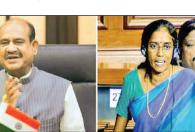
लोकसभा अध्यक्ष ओम बिरला

इससे पहले 5 फरवरी को स्पीकर ओम बिरला ने कहा था कि जिस तरह का माहौल उस दिन लोकसभा में बना, उसमें कोई भी अप्रिय और अप्रत्याशित घटना घट सकती थी। ऐसा व्यवहार संसद की गरिमा और लोकतांत्रिक मर्यादाओं के बिल्कुल विपरीत था। पीएम मोदी शाम 5 बजे बोलने वाले थे। लेकिन सांसद सीट के पास पहुंच गईं। पीएम सदन में नहीं आए और भाषण रह ही गया। अगले दिन स्पीकर ने सदन में कहा कि अनहोनी हो सकती थी, इसलिए उन्होंने पीएम को सदन में आने से रोका।