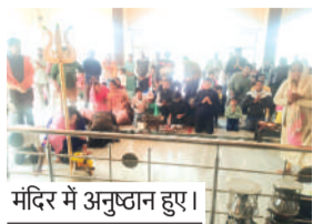
मंदिर में अनुष्ठान हुए।