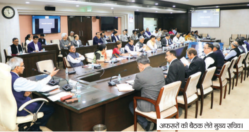
अफसरों की बैठक लेते मुख्य सचिव।

बैठक में मंत्र विधान सभा के बजट सत्र की तैयारियों, वर्तमान वित्तीय वर्ष के लक्ष्यों की पूर्ति, सुशासन के बिंदुओं सहित मंत्रि-परिषद के निर्णयों के पालन की समीक्षा की