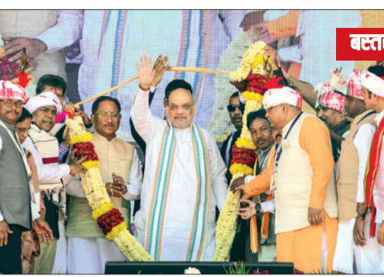
जगदलपुर में केंद्रीय गृह मंत्री अमित शाह का भव्य स्वागत किया

अमित शाह ने कहा कि पीएम मोदी का लक्ष्य बस्तर की संस्कृति और विरासत को विध्वंस तक पहुंचाना है, ताकि इसकी पहचान बंदूक और विस्फोटकों से नहीं बल्कि परंपरा से हो। रोष बचे कई नक्सलियों में युवा आदिवासी लड़कियां भी शामिल हैं, उनका पुनर्वास जरूरी है क्योंकि उनका पूरा जीवन आगे पड़ा है