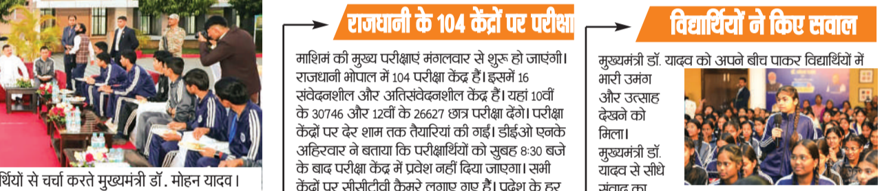
छात्राओं को दुलारते हुए मुख्यमंत्री।

और अपने सभी सपनों को साकार कीजिए। मुख्यमंत्री ने विद्यार्थियों को समय प्रबंधन, नियमित अभ्यास और किसी भी हालात में खुद पर विश्वास बनाए रखने की सलाह दी। उन्होंने कहा कि असफलता से घबराव की बजाए उससे सीख लेकर आगे बढ़ना ही एक सशक्त व्यक्तित्व की पहचान है। परीक्षा के समय सभी विद्यार्थी पर्याप्त नींद लें।