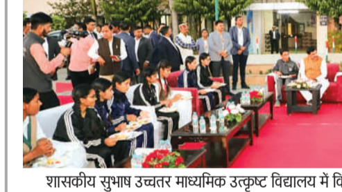
शासकीय सुभाष उच्चतर माध्यमिक उत्कृष्ट विद्यालय में विद्यार्थियों से चर्चा करते मुख्यमंत्री डॉ. मोहन यादव।

हरिभूमि न्यूज ॥ भोपाल आज के विद्यार्थी ही देश का भविष्य हैं। देश की बागडोर आगे चलकर इन्हें ही संभालनी है। इसलिए सभी विद्यार्थी अपने कौशल, ज्ञान और प्रदर्शन में निरंतर सुधार कर खुद को निखारें। परीक्षा की तैयारी पूरी मेहनत और लगन से करें, तनाव बिलकुल भी न लें। परीक्षा हमारे जीवन का एक पड़ाव मात्र है, अंतिम लक्ष्य नहीं। मेहनत करना आपकी आदत में होना चाहिए, लेकिन तनाव को खुद पर हावी न होने दें। यह बात मुख्यमंत्री डॉ. मोहन यादव ने सोमवार को विद्यार्थियों से संवाद के दौरान कहा। मुख्यमंत्री डॉ. यादव शासकीय सुभाष उच्चतर माध्यमिक उत्कृष्ट विद्यालय पहुंचे। यहां उन्होंने परीक्षा पर संवाद-2026 कार्यक्रम में विद्यार्थियों को संबोधित किया। मुख्यमंत्री डॉ. यादव ने कहा कि स्वरूप पर संदेह विश्वास बनाए रखें, किसी बात से डरकर नहीं, डरकर आगे बढ़िए।