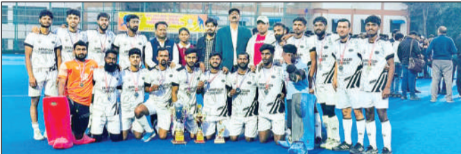
ट्रॉफी के साथ बरकतुल्ला विश्वविद्यालय की विजेता टीम।

बीयू ने पश्चिम क्षेत्र अंतर विश्वविद्यालय प्रतियोगिता 2025-26 में द्वितीय स्थान प्राप्त कर ऑल इंडिया इंटर यूनिवर्सिटी के लिए क्वालीफाई किया था। ऑल इंडिया इंटर यूनिवर्सिटी हॉकी पुरुष प्रतियोगिता आयोजन संबलपुर विश्वविद्यालय संबलपुर उड़ीसा में 22 जनवरी से 27 जनवरी तक किया गया, जिसमें बरकतुल्लाह विश्वविद्यालय ने प्रथम आठ में स्थान प्राप्त कर खेले इंडिया यूनिवर्सिटी गेम्स 2026 के लिए क्वालीफाई किया। पहला मैच एसआरएम चेन्नई से एक-एक से बराबर रहा दूसरा मैच गुरुकुल कांगड़ी विश्वविद्यालय हरिद्वार ने 4-1 से हराया काशी विद्यापीठ के साथ 1-1 बराबरी का मुकाबला रहा जबकि एलपीयू से के