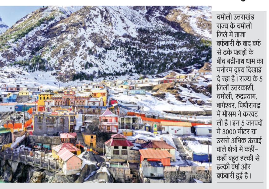
चमोली उत्तराखंड राज्य के चमोली जिले में ताजा बर्फबारी के बाद बर्फ से ढके पहाड़ों के बीच बद्रीनाथ धाम का मनोरम दृश्य दिखाई दे रहा है। राज्य के 5 जिलों उतरकाशी, चमोली, रुद्रप्रयाग, बागेश्वर, पिथौरागढ़ में मौसम ने कवचट ली है। इन 5 जनपदों में 3000 मीटर या उससे अधिक ऊंचाई वाले क्षेत्रों में कहीं-कहीं बहुत हल्की से हल्की बर्फबारी हुई है।