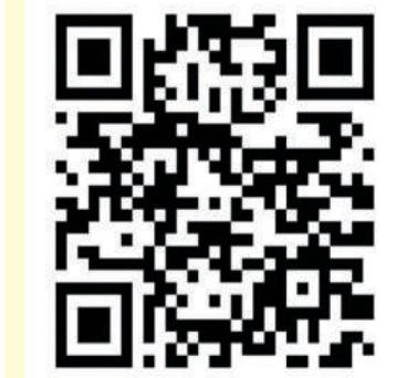
मुख्यमंत्री डॉ. मोहन यादव का संबोधन सुनने के लिए स्कैन करें

मुख्यमंत्री डॉ. यादव ने बालाघाट पुलिस लाइन में किया कार्यक्रम को संबोधित जहां बंदूकें गूंजती थीं, वहां अब रोजगार-विश्वास और शिक्षा का शंखनाद होगा- मुख्यमंत्री डॉ. यादव को म. प्र. पुलिस की और से बालाघाट पुलिस अधीक्षक ने किया आश्वस्त