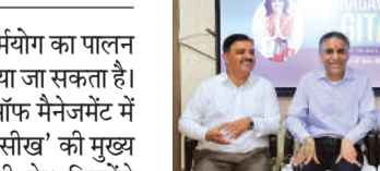
विद्यार्थियों के लिए भागवद गीता पर सत्र में उपस्थित अतिथि।