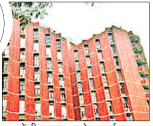
केंद्रीय चुनाव आयोग कार्यालय

शीर्ष अदालत ने पश्चिम बंगाल सरकार की ओर से निर्वाचन आयोग को गुप-बी के 8,505 अधिकारियों की सूची उपलब्ध कराए जाने का संज्ञान लिया। उसने कहा कि इन अधिकारियों को एसआईआर प्रक्रिया में प्रशिक्षित और नियोजित किया जा सकता है। पीठ ने स्पष्ट किया कि मतदाता सूची में संशोधन के सिलसिले में अंतिम निर्णय हमेशा मतदाता सूची