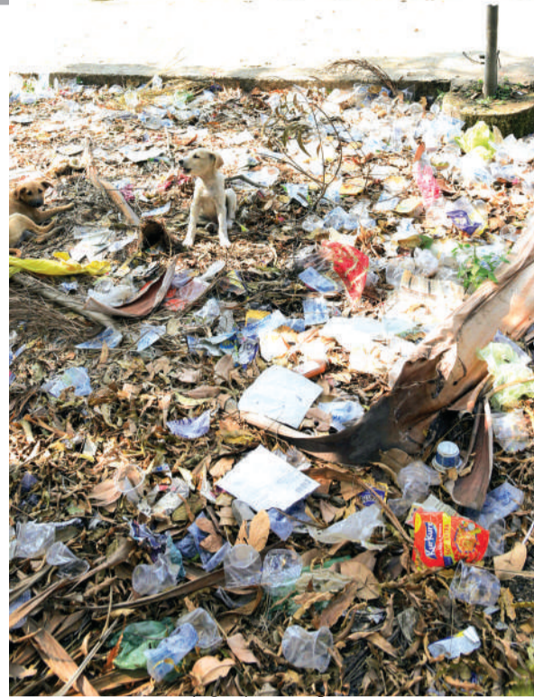
तालाब के किनारे लगा गंदगी का अंबार।