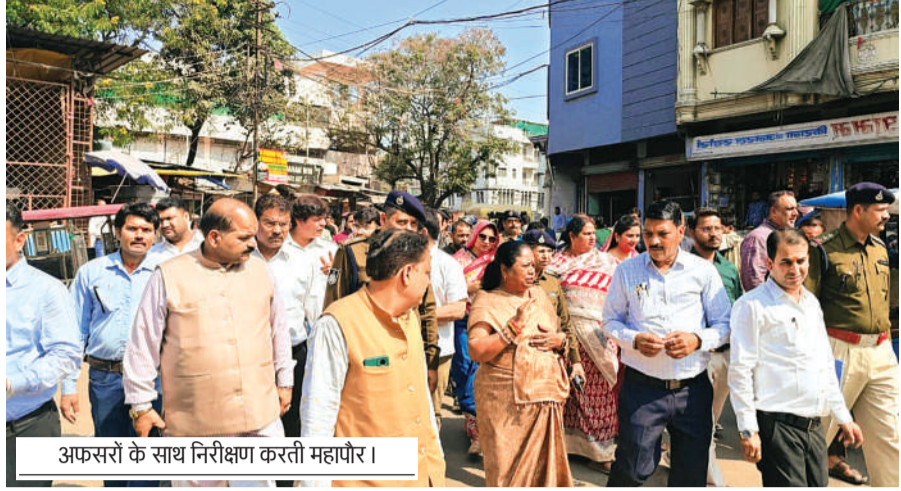
अफसरों के साथ निरीक्षण करती महापौर।