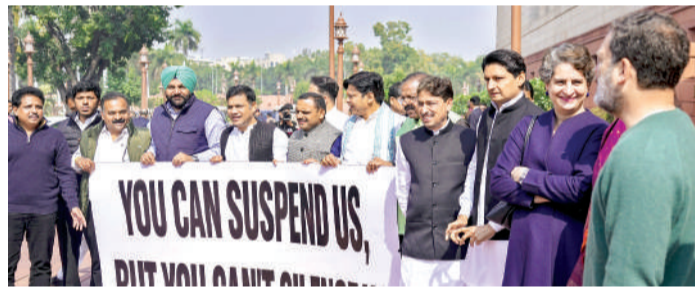
विपक्षी सांसदों का प्रदर्शन, पोस्टर में लिखा 'आप हमें खामोश नहीं कर सकते'

बिरला से मुलाकात के बाद संसद चलने देने पर सहमति बनी आज से व्यवधान नहीं