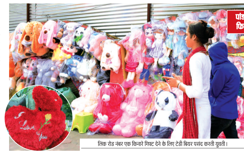
लिंग रोड नंबर एक किनारे गिफ्ट देने के लिए टेडी बियर पसंद करती युवती।