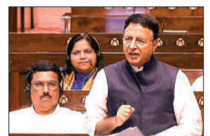
रणदीप सिंह सुरजेवाला फाइल फोटो

राज्यसभा में बजट 2026-27 पर चर्चा के दौरान कांग्रेस के वरिष्ठ नेता रणदीप सिंह सुरजेवाला ने केंद्र सरकार पर तीखा प्रहार किया। उन्होंने कहा कि सरकार जिस बजट को 'रिफॉर्म एक्सप्रेस' बता रही है, वह हकीकत में पहले ही स्टेशन पर पटरी से उतर चुकी है। सुरजेवाला ने बजट को शब्दों और जुमलों का पुलिंदा बताते हुए कहा कि इसमें न तो ठोस सुधार हैं और न ही आम जनता के लिए राहत। भारी-भरकम दावे, बड़ी-बड़ी घोषणाएं और आकर्षक भाषण जरूर दिए गए, लेकिन जमीनी सच्चाई यह है कि यह बजट पटरी से उतर चुका है। सुरजेवाला ने इसे 'कटौती बजट' करार देते हुए कहा कि सरकार ने चुपचाप हर अहम क्षेत्र में कैंची चला दी है। कृषि क्षेत्र को लेकर कहा कि पिछले बजट में 'फूड बास्केट ऑफ द वर्ल्ड' बनने की बातें हुईं और कई मिशनों की घोषणा हुई, लेकिन जमीनी हकीकत बिल्कुल अलग है। कॉटन टेक्नोलॉजी, दाल, सब्जी-फल मिशन, हाईब्रिड बीज मिशन पर एक पैसा खर्च नहीं किया गया है।